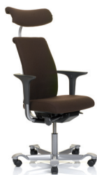
HÅG H05 5500 m/hodehviler (opsjon)